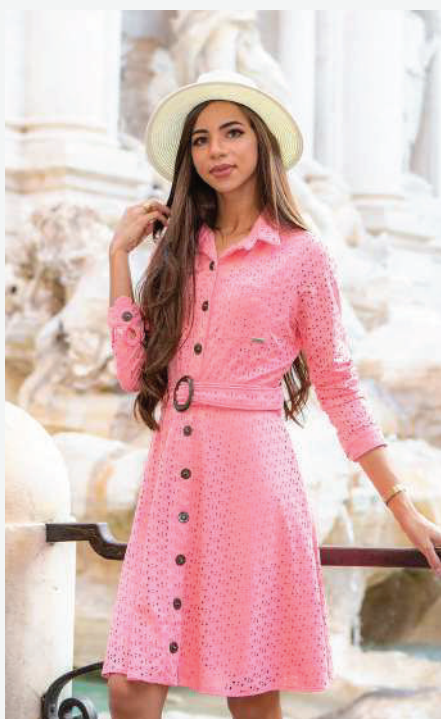
A Pernambucana Lilium Isis, vencedora do concurso JFB3 em ROMA - ITÁLIA